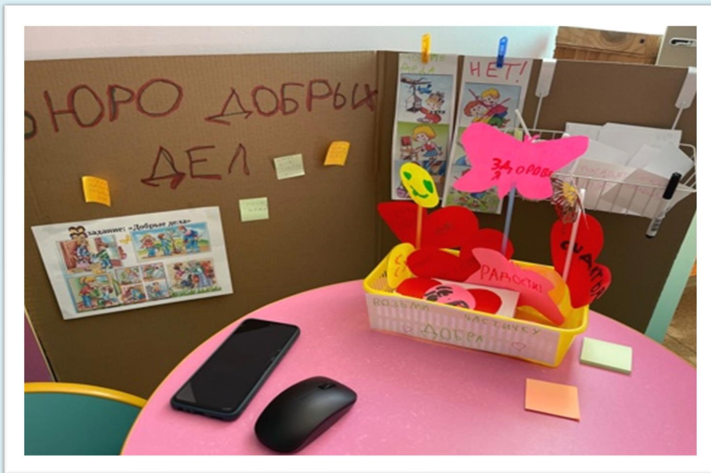
Сюжетно-ролевая игра «Бюро добрых дел»